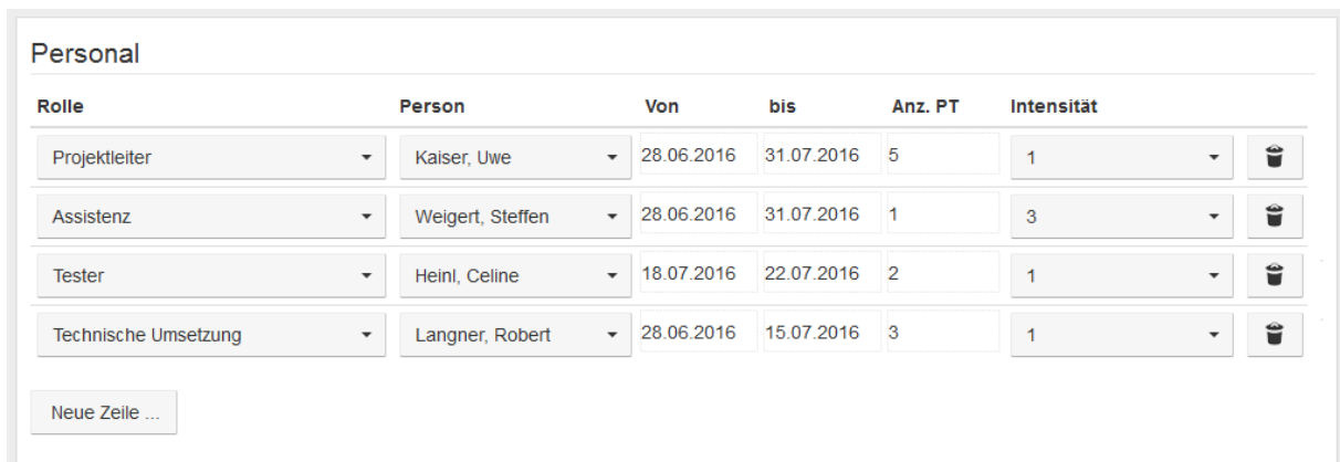
Abb.3: Innerhalb der Vorhabenakte können alle Informationen zu den Projektbeteiligten eingetragen werden.

Innerhalb der Vorhabenakte werden in dem Reiter Personal die Zuweisungen vorgenommen (siehe Abb. 3). Neben der Projektrolle und dem Einsatzzeitraum kann auch die Anzahl der Personentage abgebildet werden.